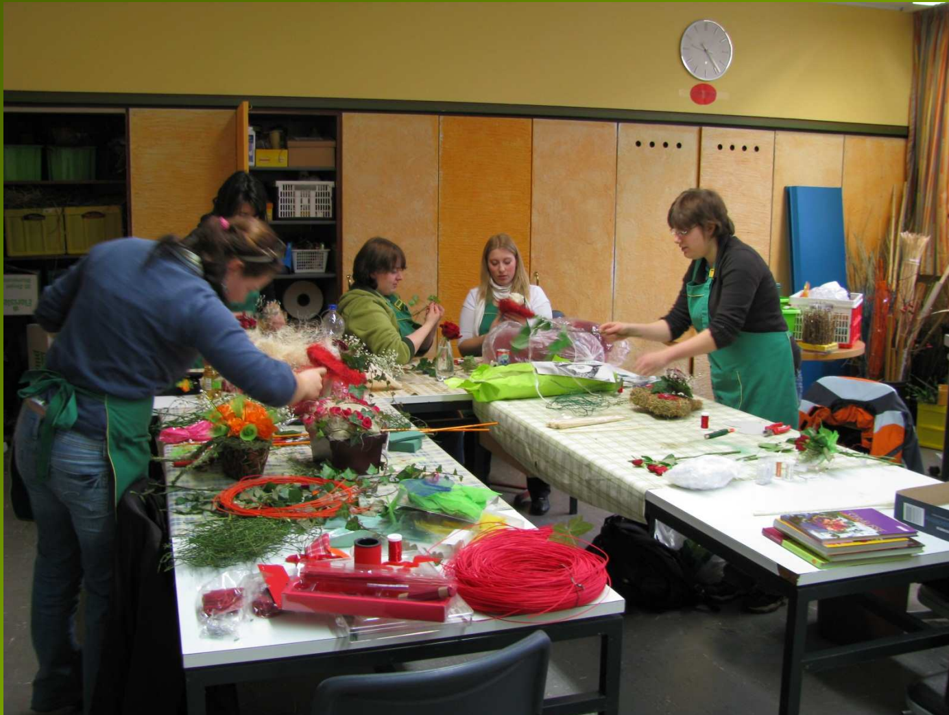
Das SG-Zimmer (Service & Gestalten)